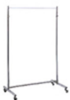
シングルハンガー