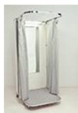
フィッティング ルーム